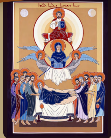
The Assumption of the Virgin Mary & Eleventh Sunday of Pentecost

When we look around us, we see many signs of hope in our lives and in the lives of our community. Our parishes are alive again with spiritual and social events and our Maronite Eparchy in Australia prepares to celebrate 50 years of its establishment in 2023. After more than 100 years of Maronite presence in this land, the Eparchy was established on the 14th of July 1973. Our Jubilee Year shall