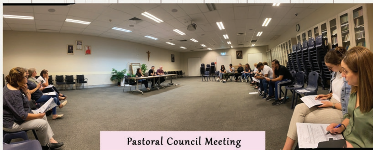
Pastoral Council Meeting