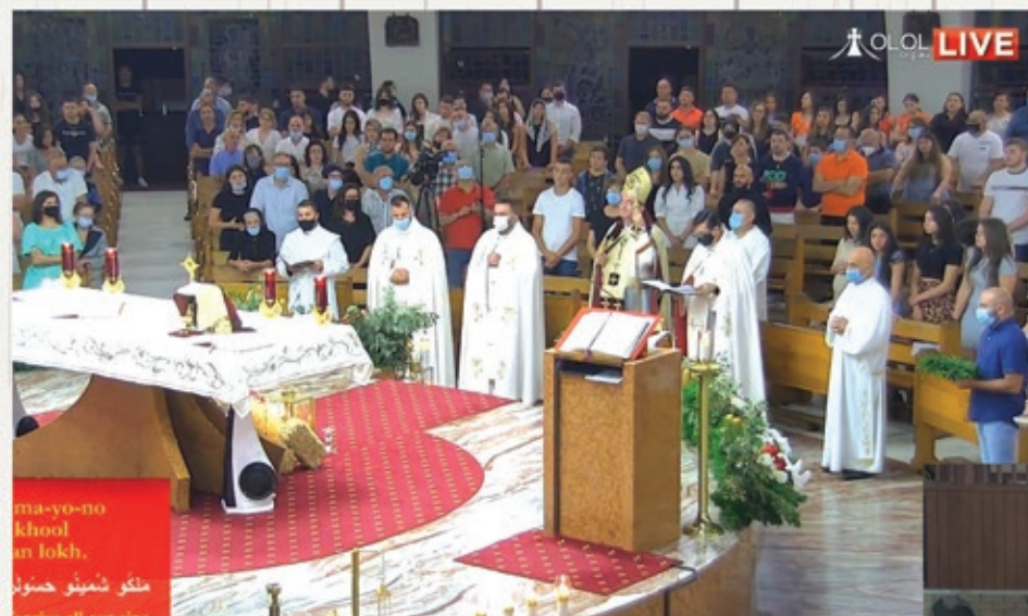
Christmas midnight Mass