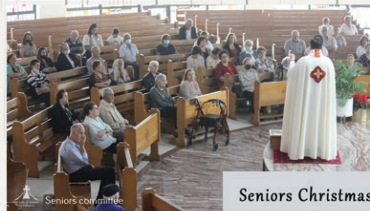
Seniors Christmas Mass & Christmas Party