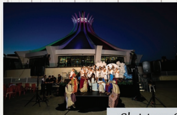
Christmas Carols & Festival