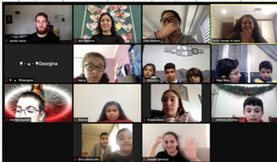
Final Fersen zoom lesson of the term