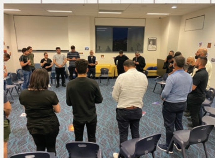
Vocations Discernment Night