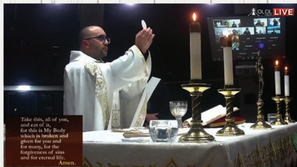
Youth Zoom Mass