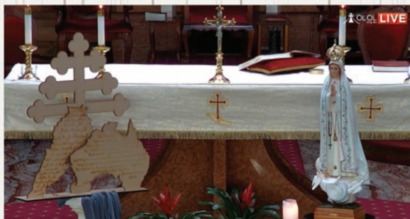
Fatima Rosary & Mass