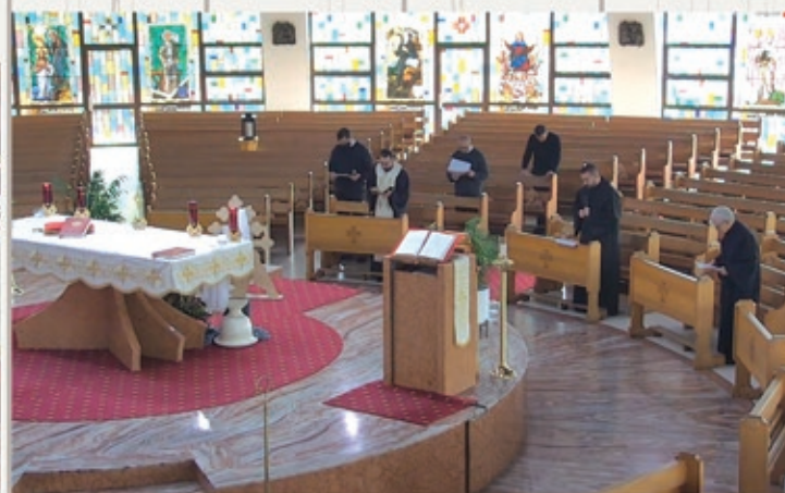
Midday Prayer & Angelus