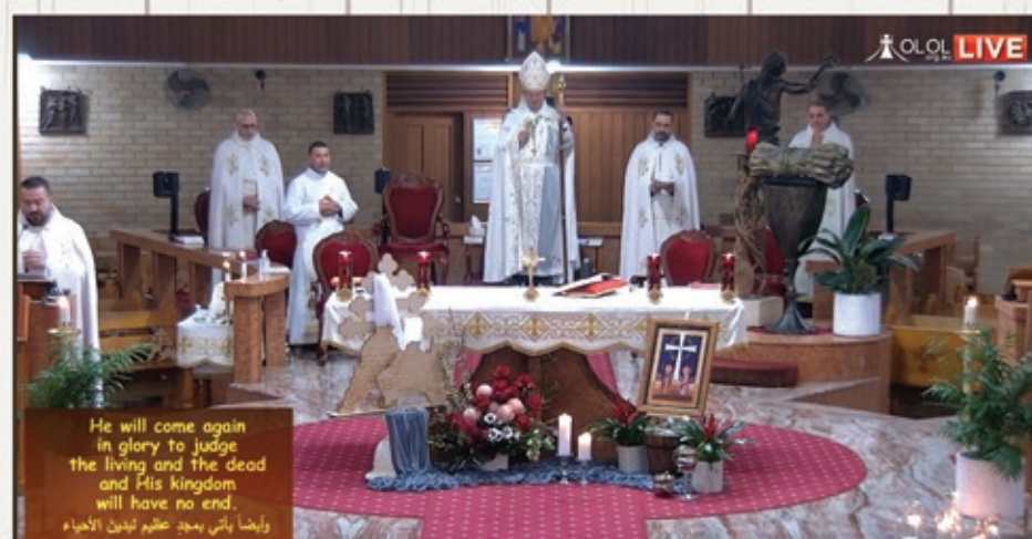
Feast of the Exaltation of the Holy Cross