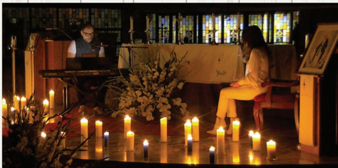
Virtual Concert - Anta Horriyati