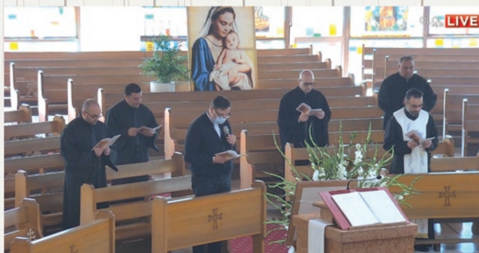
Midday Marian Prayer & Angelus