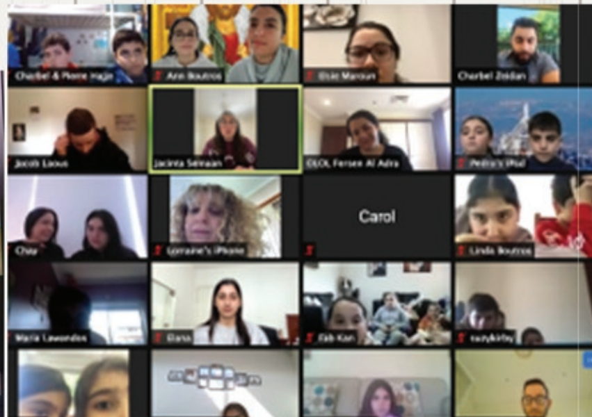
Fersen zoom lesson - Saturday 24 July