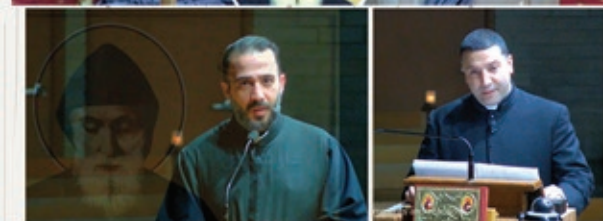
FDW St Charbel's Mystery