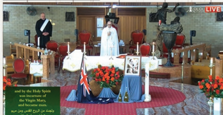
St Joseph Masses