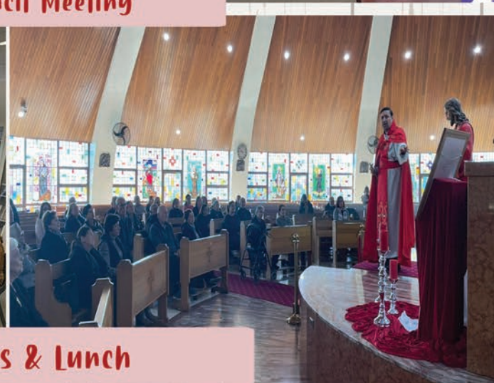
Senior's Mass & Lunch