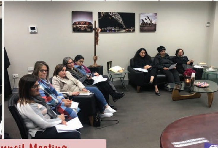
Pastoral Council Meeting