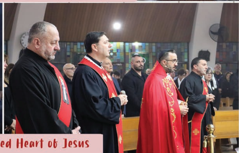
Feast of The Sacred Heart of Jesus