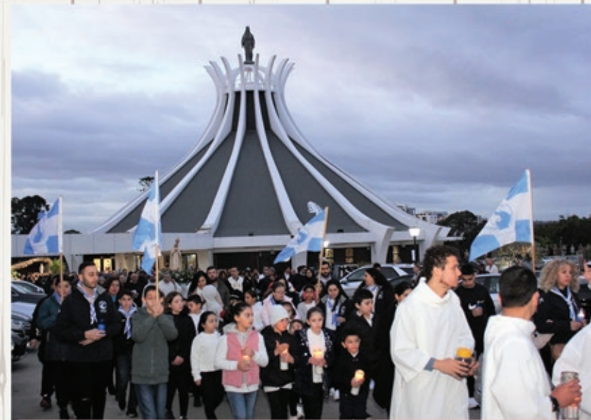
End of May - Marian Procession