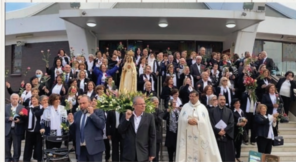
Feast of Corpus Christi