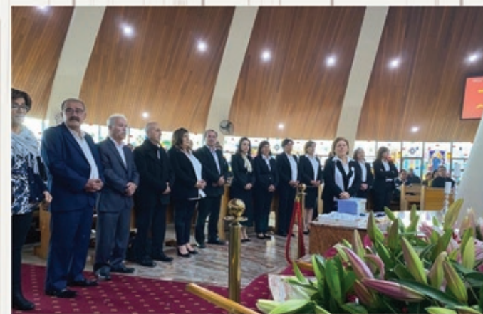
Sodality of the Immaculate Conception