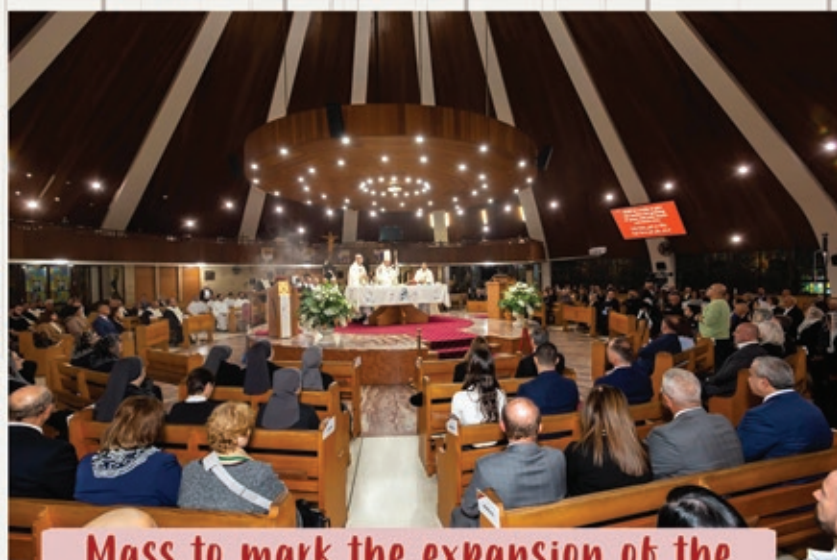
Mass to mark the expansion of the borders of the Maronite Eparchy