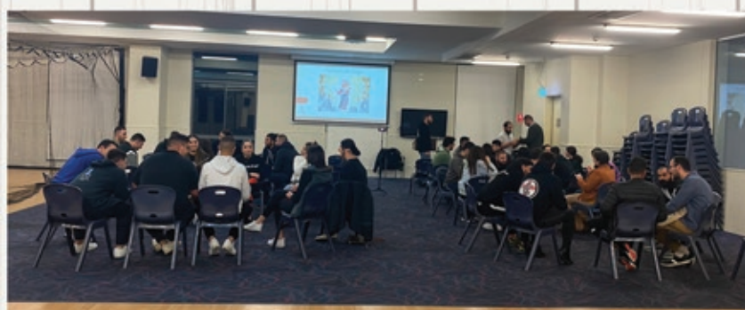
Faith on Fire