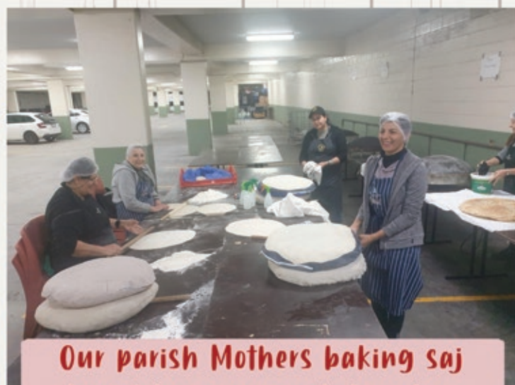
Our parish Mothers baking saj bread for our parish families