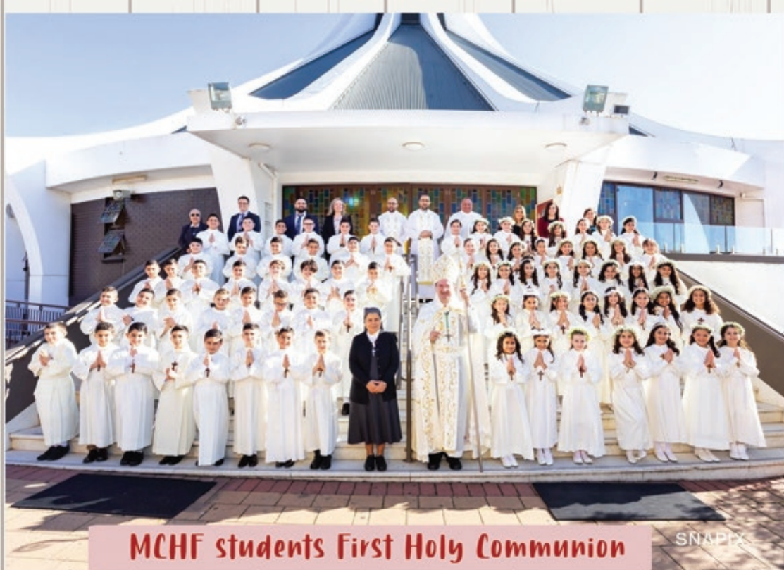
MCHF students First Holy Communion