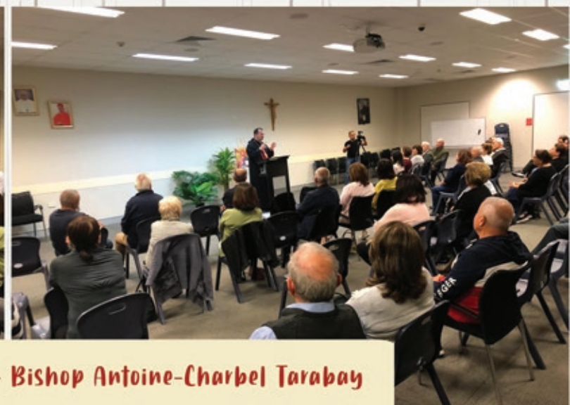
Family of The Divine Word - Bishop Antoine-Charbel Tarabay