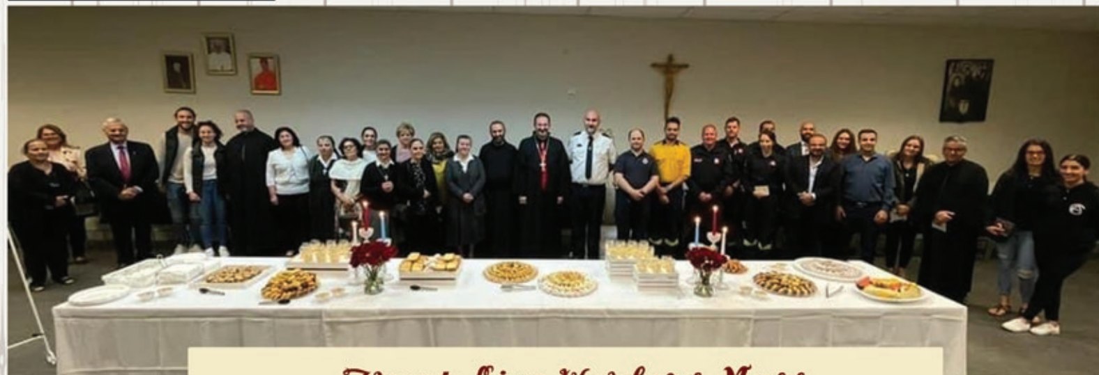
Front Line Workers Mass