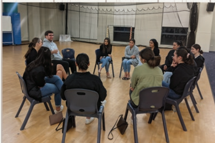
Faith on Fire