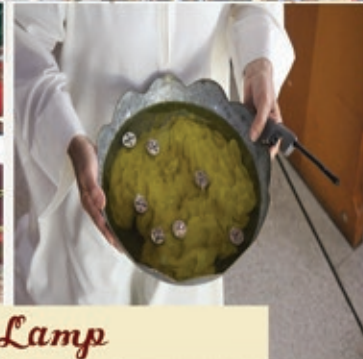
Rite of the Lamp