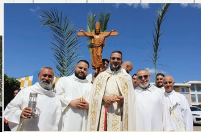
Palm Sunday Celebrations