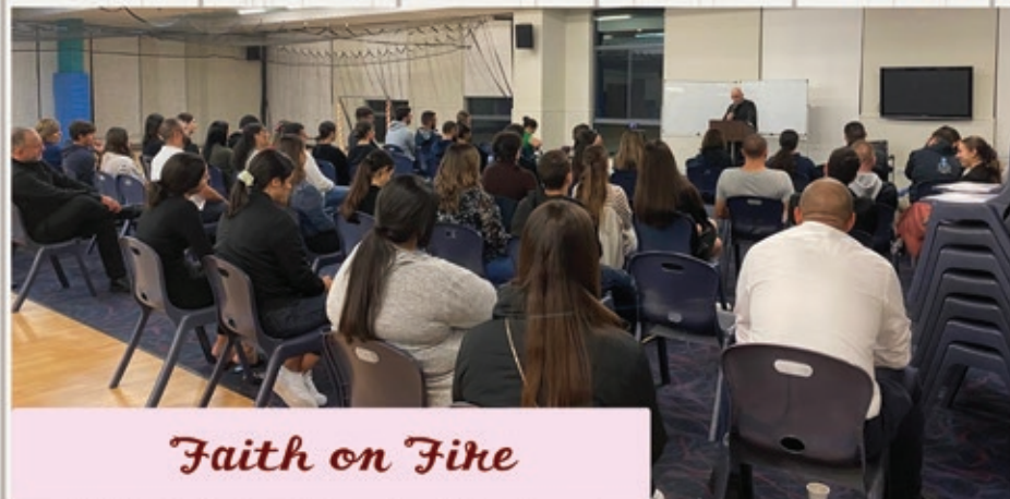
Faith on Fire