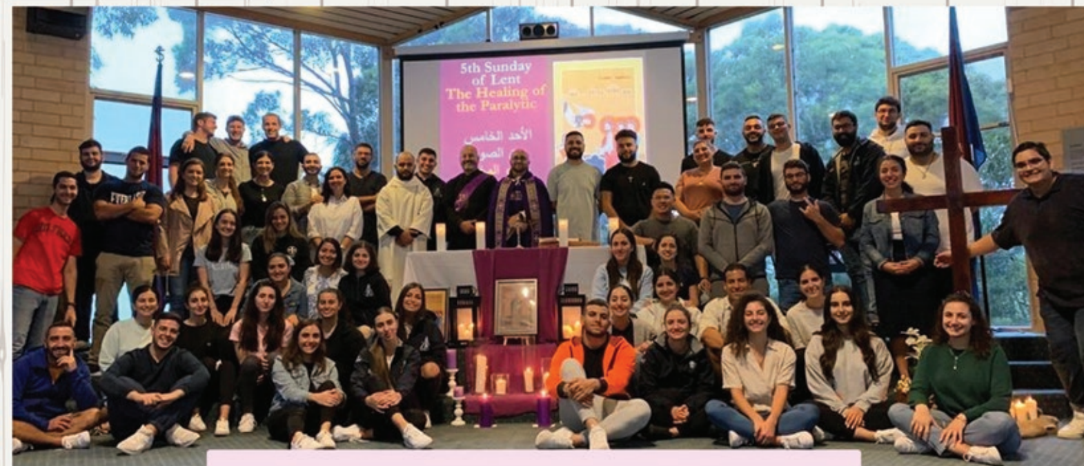
Youth Lenten Retreat