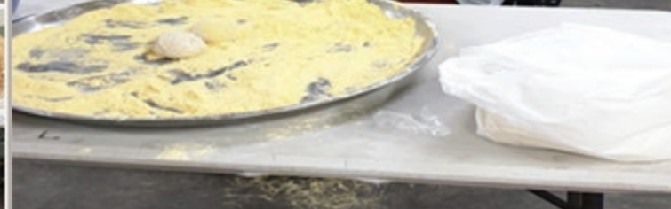
Thank you to the Sodality & the ladies of the parish for the hard work they put in baking bread