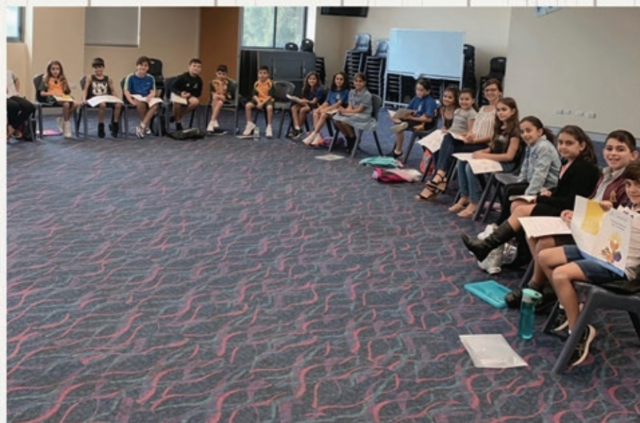
Holy Communion Classes 2021