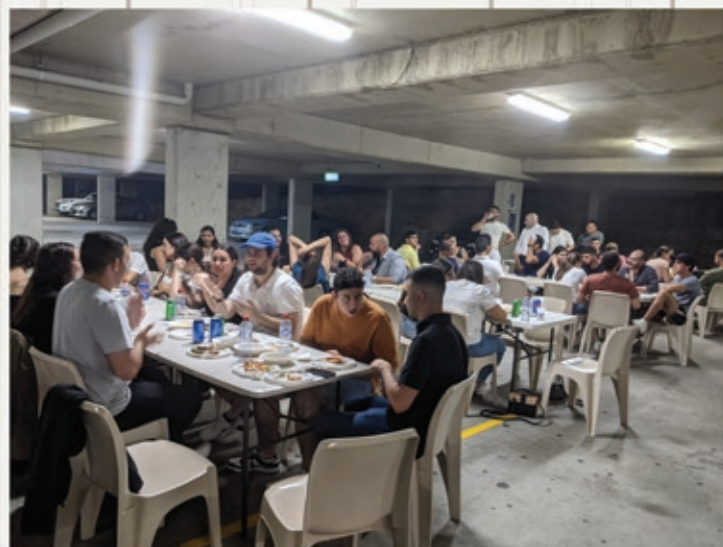
Youth Pre~Lenten BBQ