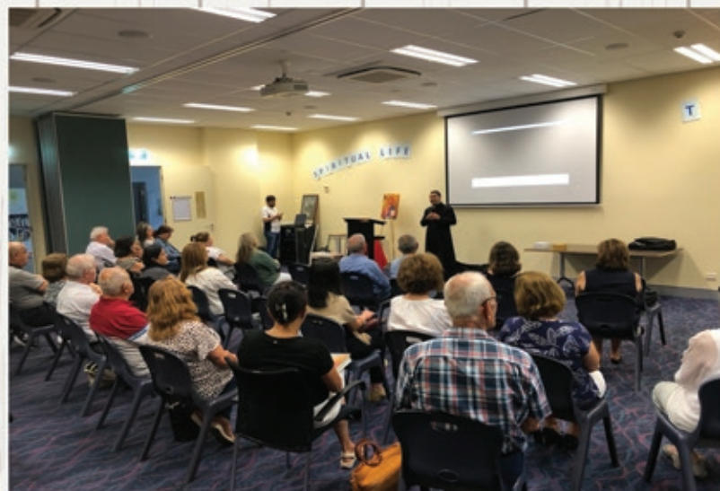
Family of The Divine Word ~ Bible Study