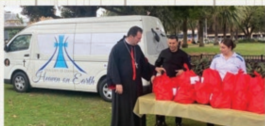
Heaven on Earth serving those in need over Christmas