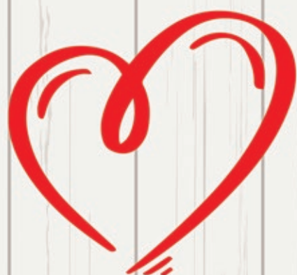
Senior's Committee visiting our precious seniors