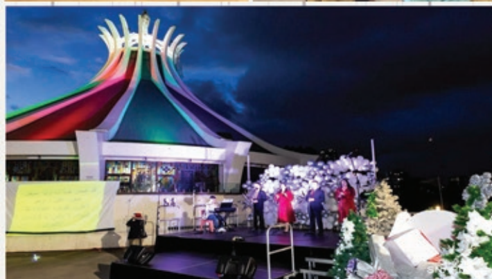
Carols by Candlelight