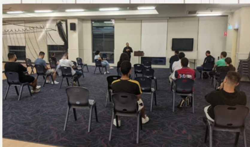
Faith on Fire