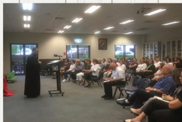
Family of The Divine Word