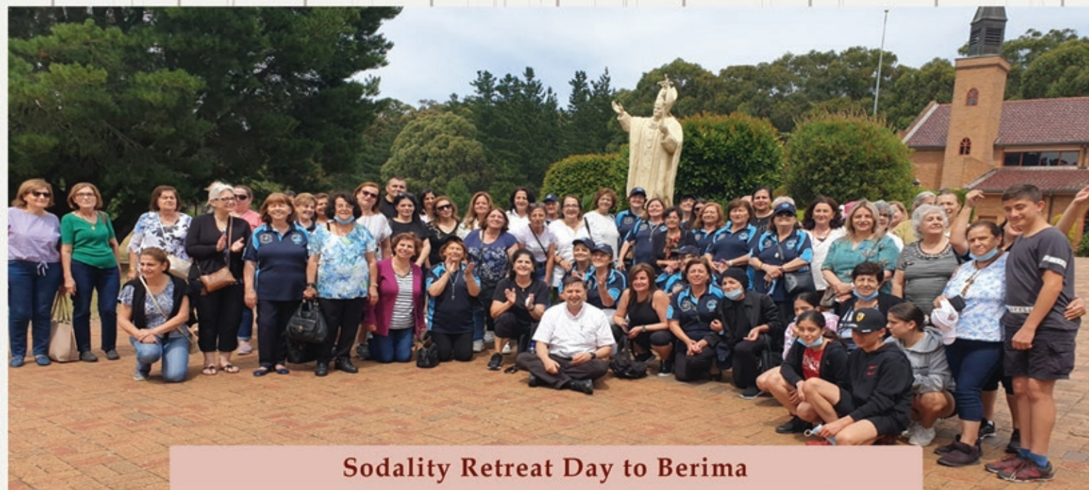
Sodality Retreat Day to Berima