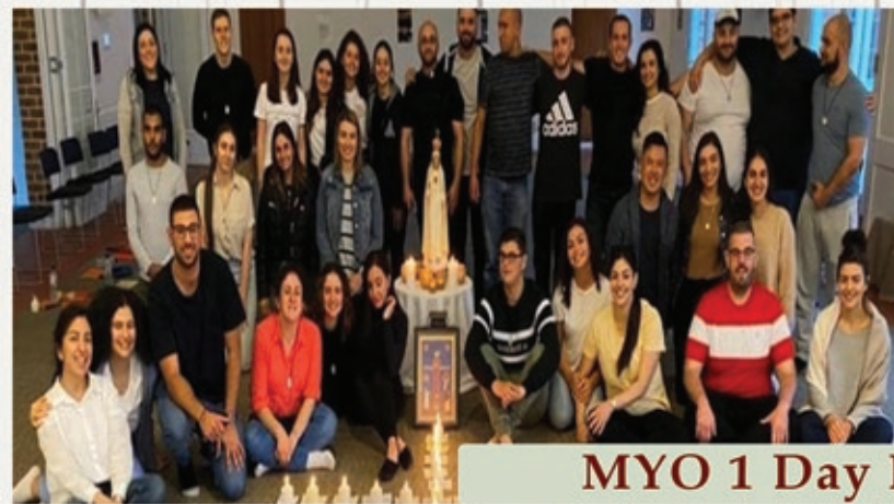
MYO 1 Day Retreat