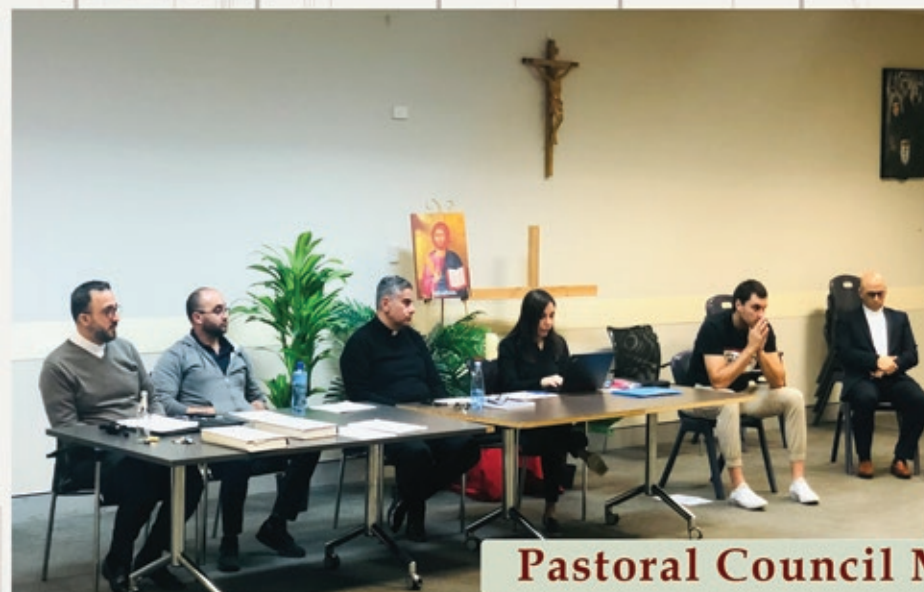
Pastoral Council Meeting