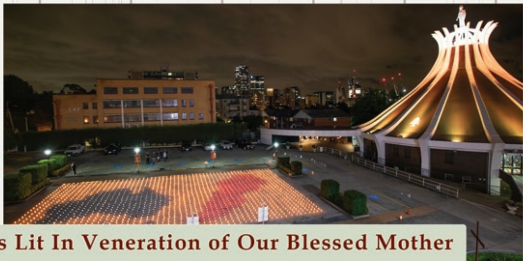
2020 Candles Lit In Veneration of Our Blessed Mother