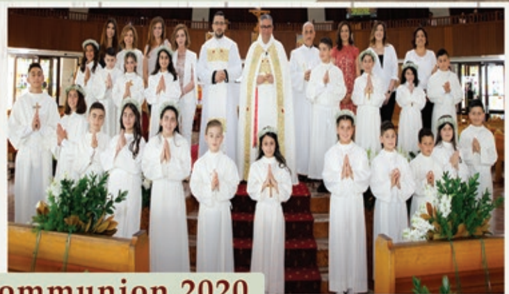
OLOL Holy Communion 2020