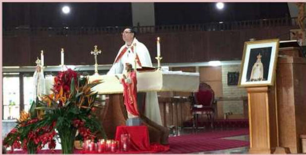
13th of the Month Mass