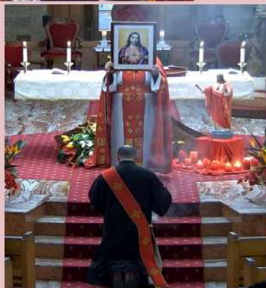
Feast of the Sacred Heart of Jesus Mass