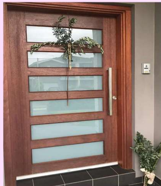
Palm Sunday Home Decorations