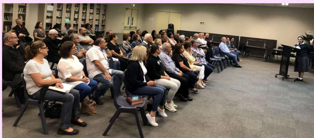
Family of The Divine Word - Weekly Talk