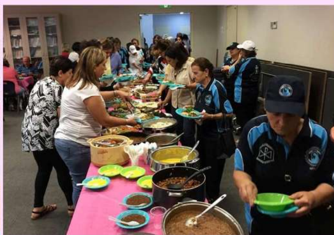
Lenten Lunch organised by The Sodality of The Immaculate Conception