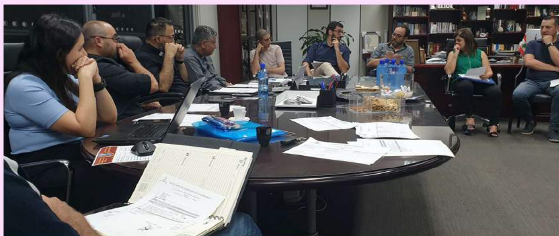
Pastoral Council Meeting