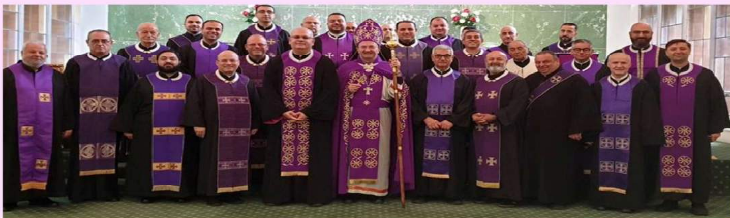
Annual Clergy Retreat