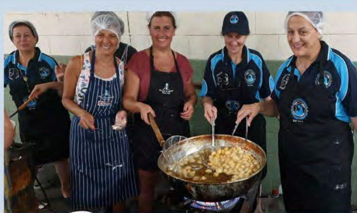
LOL SODALITY PREPARING SWEETS FOR THE EPIPHANY OF OUR LORD