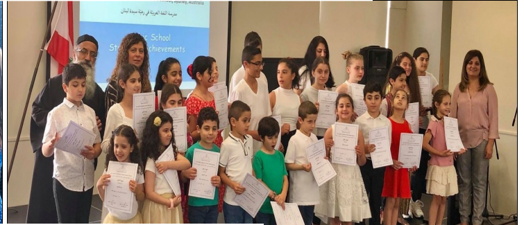
OLOL Arabic School End of Year Performance 2019