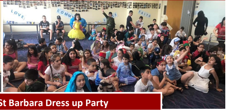
OLOL Fersen Al Adra - St Barbara Dress up Party