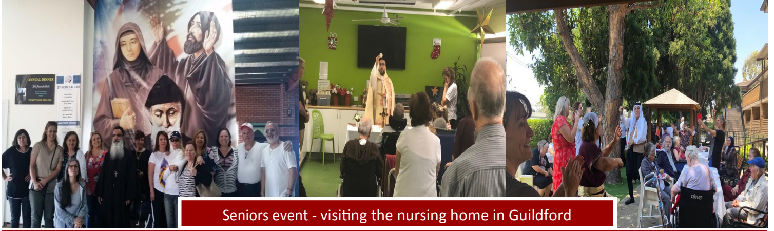
Seniors event - visiting the nursing home in Guildford