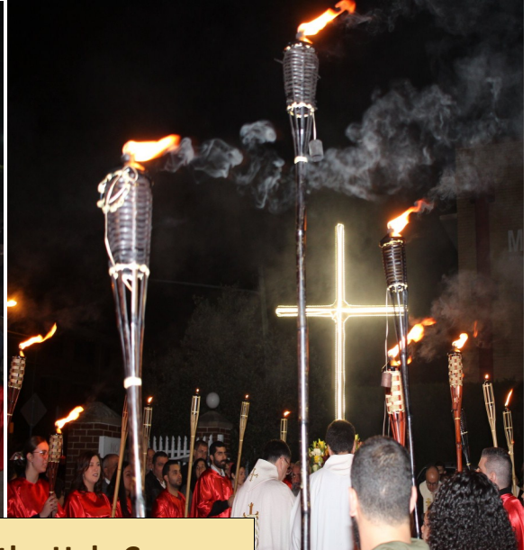
Feast of the Exaltation of the Holy Cross