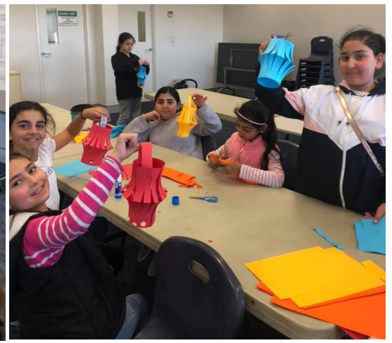
Fersen Year 4 learning about the importance of respect & dignity and creating lantern craft