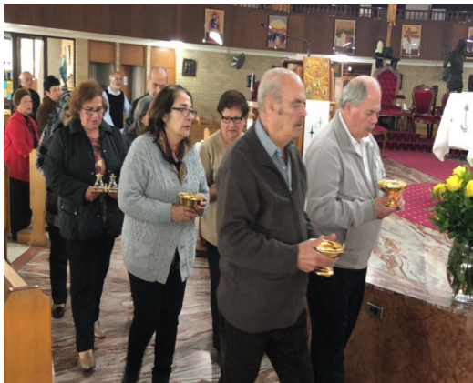
Senior's Feast of The Assumption celebrations