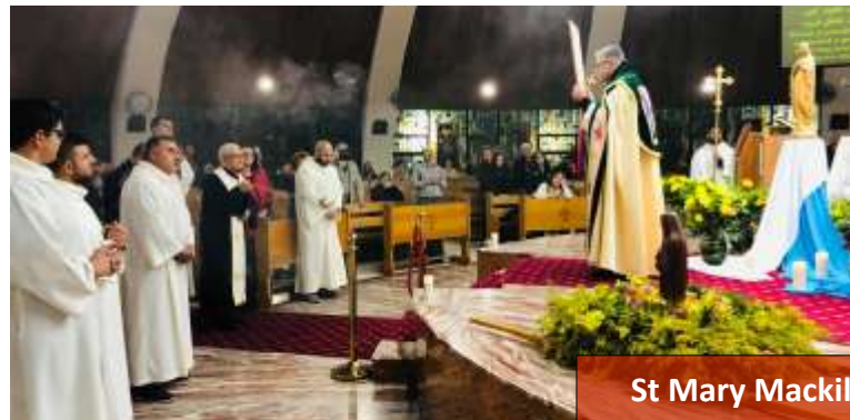
St Mary Mackillop Mass