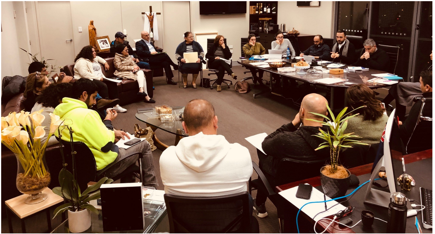
Pastoral Council - FW.19 Preparation