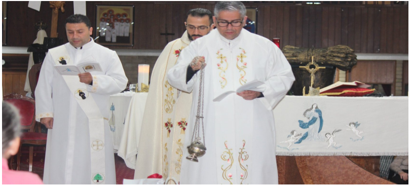
Saint Rita's Feast Day Mass