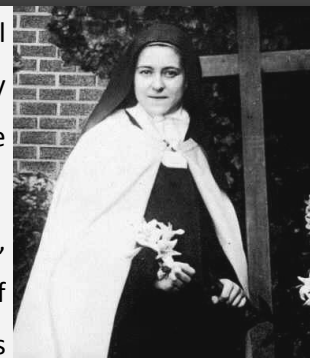
Saint Therese of Lisieux

O Mother! beneath thy veil let my tired spirit rest, For this brief passing day! Soon shall I fly afar among the holy choirs, Then shall be mine the joy that never knows decay; And then my lips shall sing, to heaven's angelic lyres, the eternal, glad today!