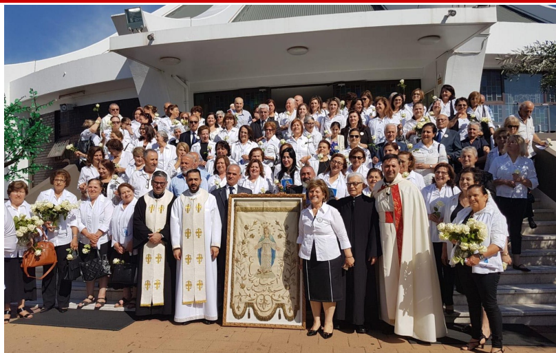
The Sodality of The Immaculate Conception renewed their promise and allegiance