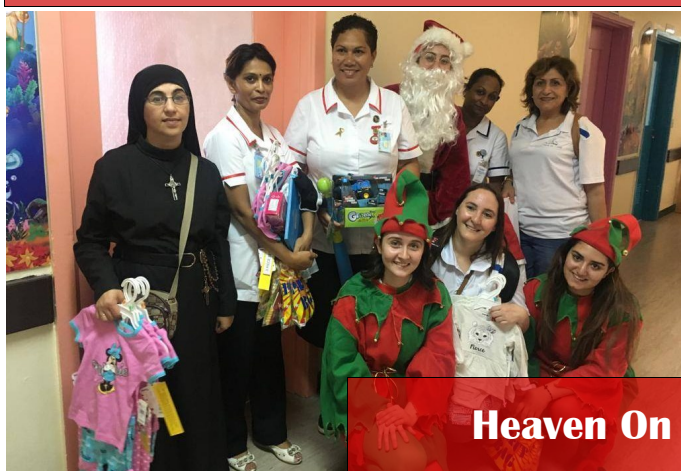
Heaven On Earth - Trip To Fiji