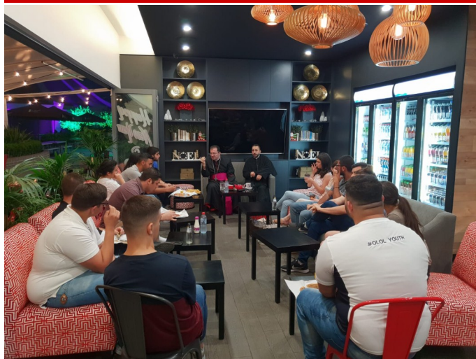
Youth Q&A with the Bishop @ 5 Loaves Café