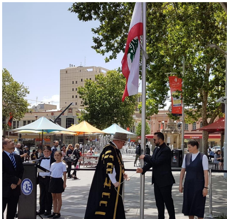
Parramatta Council Celebrating The 75th Anniversary of The Lebanese Independence Day