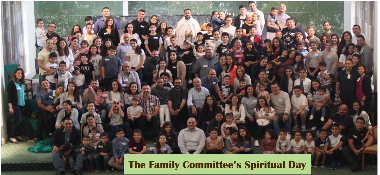
The Family Committee's Spiritual Day