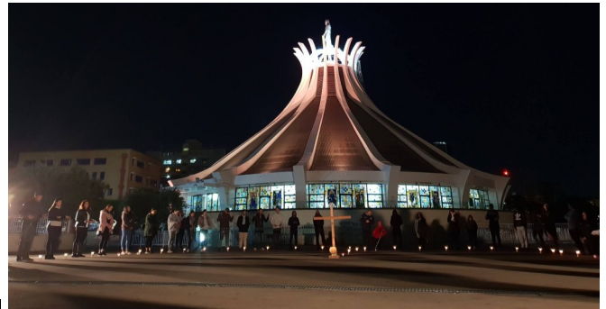
MYO - Human Rosary