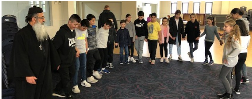
The Arabic School Activities