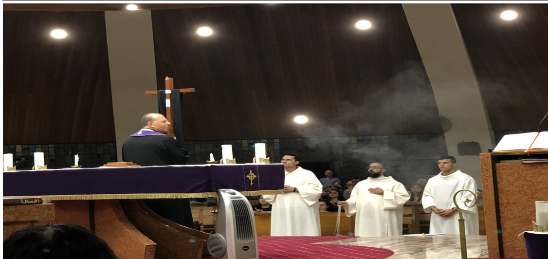
Stations & Adoration of The Cross