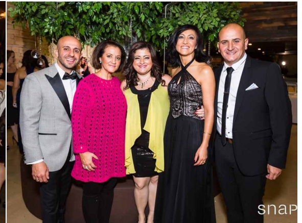
OLOL Annual Gala