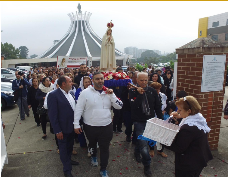
Procession from OLOL to St Patrick's Cathedral - celebrating 100 years since Our Lady appeared to the children