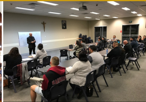
Syriac of the mass course - Lesson 1