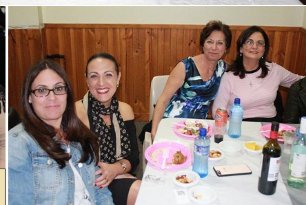
Mother's Day 2017