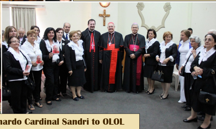
The visit of His Eminence Leonardo Cardinal Sandri to OLOL