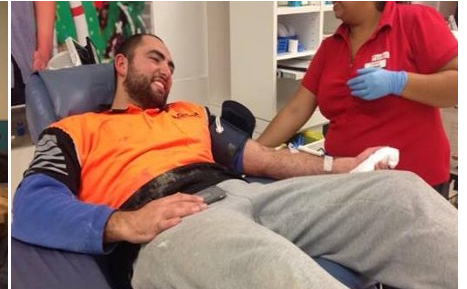
Youth Blood Donations