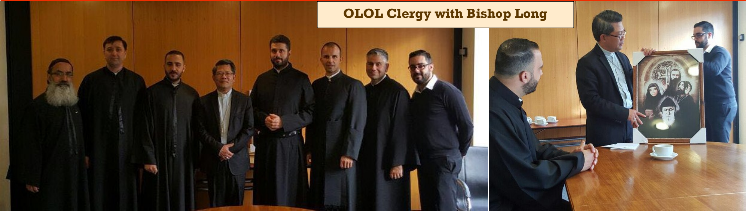
OLOL Clergy with Bishop Long