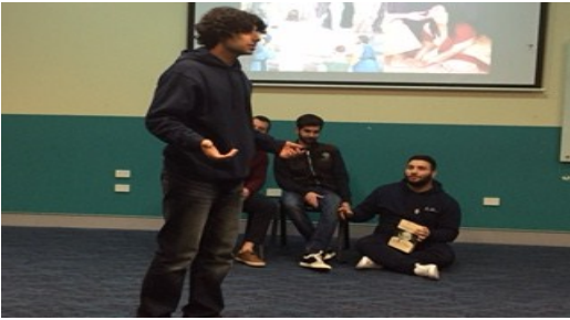
Teen Leaders Formation Day and Consecration Mass