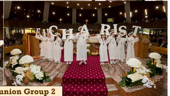
Holy Communion Group 2