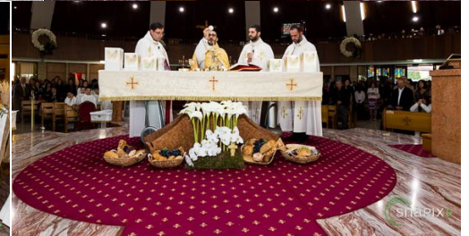
OLOL 1st Holy Communion (Group 1)