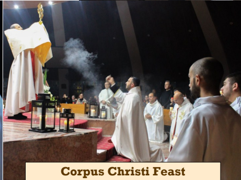
Corpus Christi Feast