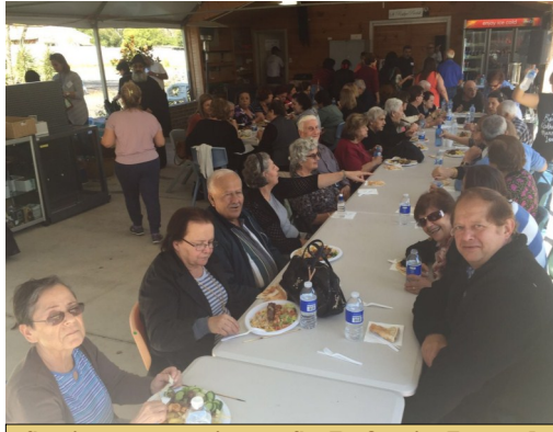
Seniors excursion to St. Rafqa in Austral